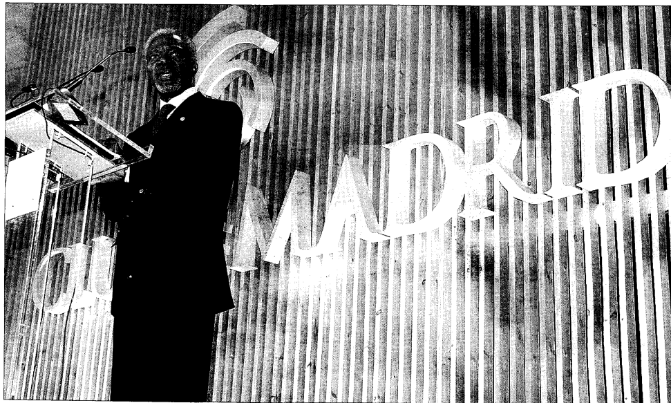
El secretario general de Naciones Unidas, Kofi Annan, durante su intervención en la Cumbre Internacional sobre Democracia, Terrorismo y Seguridad de Madrid.

El secretario general de Naciones Unidas reconoce que esta organización debe estar a la vanguardia mundial para hacer frente «a la mayor amenaza mundial de este siglo»